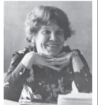
25 января 2016 года на 71-м году жизни после тяжёлой болезни скончалась